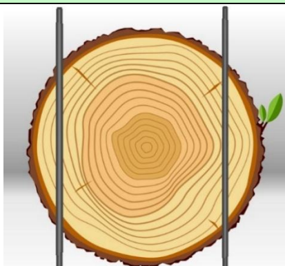
Схема распила 2 четырьмя пилами:

(на станок устанавливается 2 пилы, расстояние между пилами регулируется проставками)