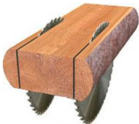
Схема распиловки лафета при производстве досок. На вал допускается устанавливать до 7-ми пил (диаметр дисковой пилы до D=450 мм). Минимальная ширина доски – от 20 мм.

Схема распиловки при производстве четырехкантного бруса. Ширина между пилами регулируется комплектами проставок (размеры под заказ). Максимальные размеры бруса: высота до 150 мм, ширина до 300 мм.